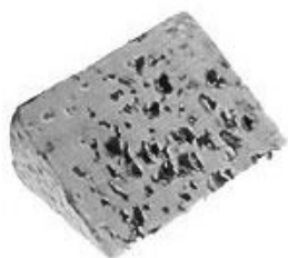
« Roquefort, quatre mois de fermentation »

Au bout d'un moment, un homme noir m'accoste. « Wassup » lance-t-il sans emphase. Dans le langage populaire américain, cela veut dire « comment ça va? ». Il me demande si j'ai besoin de « quelque chose ». J'ai bien compris ce qu'il voulait dire : dans le business on parle avec des codes, de crainte d'avoir affaire à la police. C'est l'éternelle peur du gendarme. Je lui demande avec fermeté à combien il me fait la tranche de gruyère. Il a l'air surpris de ma sagacité, mais me répond : « thirty bucks » (30 dollars américains soit 33 euros). Pour lui montrer que je ne suis pas un débutant, je lui demande : « Combien de matière grasse? » Souvent, les dealers coupent la came avec du fromage pasteurisé, et le taux de graisses s'en ressent. Il me répond : 45 %. Je vois que ça n'est pas un rigolo, alors je vais plus loin : je lui demande du chèvre et du reblochon. Il dit pouvoir aligner la marchandise demain.