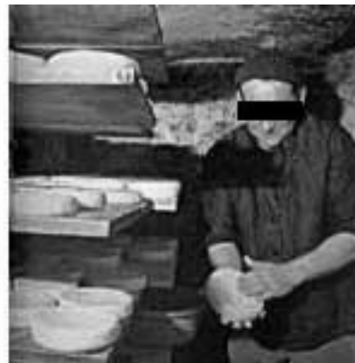
Dealer de munster (en caméra cachée)

joint : morceau de plastique élastique destiné en général à prévenir les fuites d'eau.