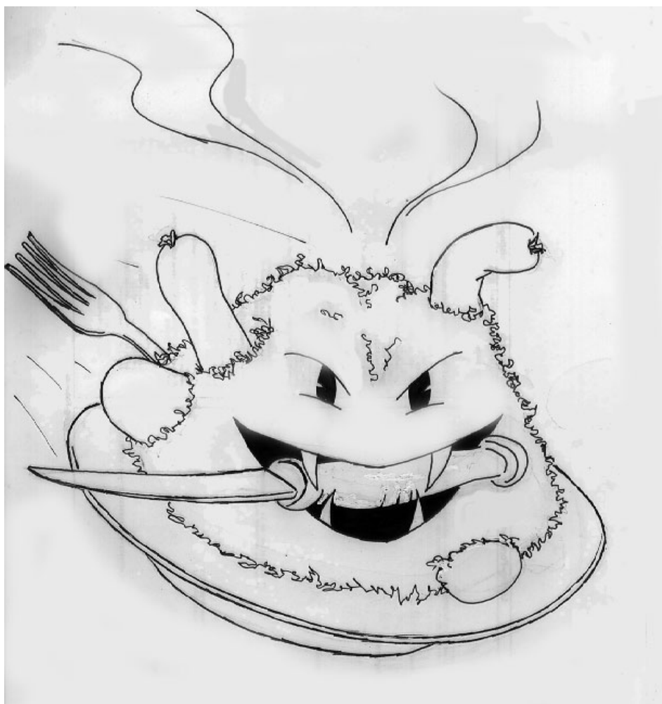
Choucroute ricanante (Septembre 2002) 21x29,7 ; Stylo sur papier brouillon