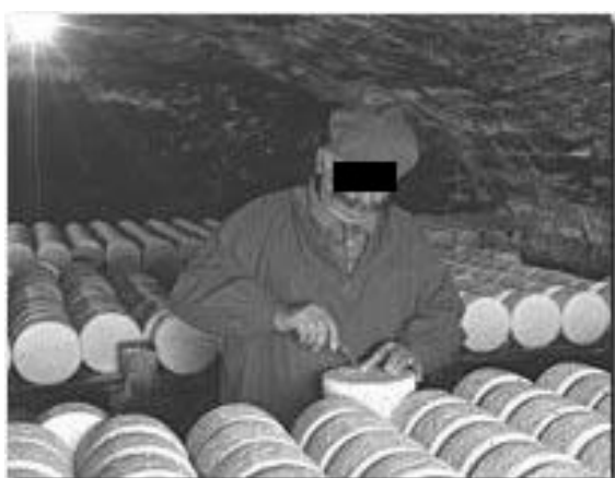
Producteur de fromage en train d'examiner sa production (en caméra cachée)