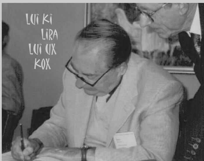
Le ministre Adémar Borg signant la première loi en « fraxse ».

Le succès du référendum s'explique par la rencontre inattendu d'intérêts contradictoires. C'est la coalition de rouges-verts au pouvoir qui est à l'origine du projet. Il s'agissait de rendre la langue véritablement accessible pour tous. Le français officiel constituait, selon les porteurs du projet, une langue de clercs, que seul une élite de pri-