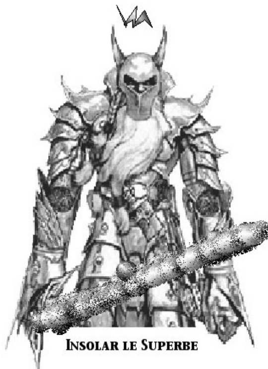
INSOLAR LE SUPERBE

Jugez Lecteur, tandis que les deux amants gagnent leur couche et se font moult caresses, tandis que la foule bavarde et se disperse, qui de nos deux amants est le plus heureux ? L'Impératrice, qui se voit libérée de l'atroce contrainte qui l'astreignait à l'infidélité, et dans le même instant retrouve sa possession qu'elle croyait pour toujours perdue, et se voit assurée de la garder près d'elle pour l'éternité des Cyclades ? Ou Lovardent, qui connaît assurément l'amour de sa propriétaire, et sa fidélité, et qui peut jouir sans inquiétude de ses caresses ? Je te laisse en décider, Lecteur, car quant à moi je ne suis pas versé en ces choses de l'amour, et ne saurait lire ce qui se passe en ces cœurs.